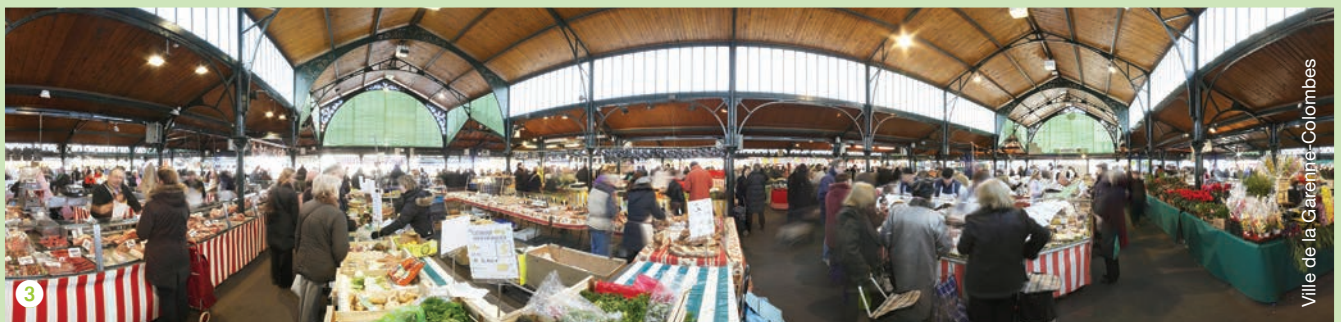
Ville de la Garenne-Colombes