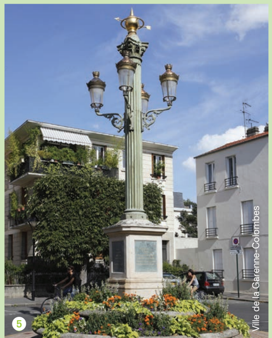
Ville de la Garenne-Colombes