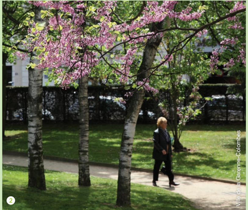
Ville de la Garenne-Colombes