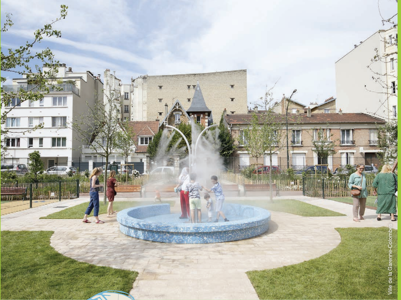
Ville de la Garenne-Colombes