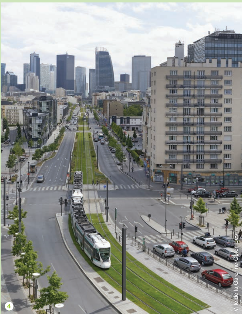
Ville de la Garenne-Colombes