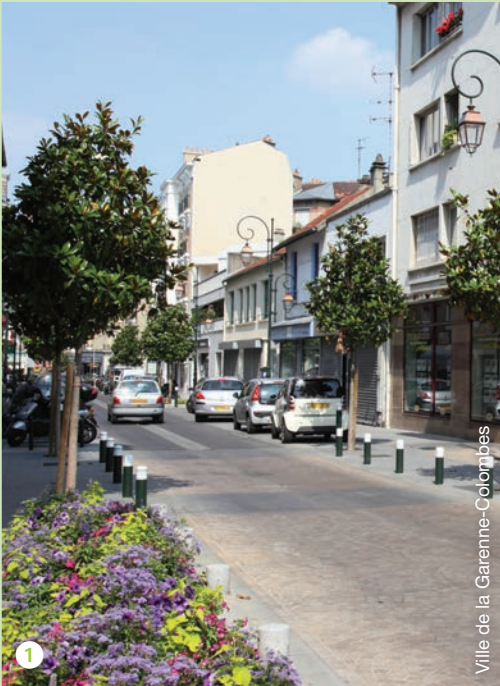
Ville de la Garenne-Colombes