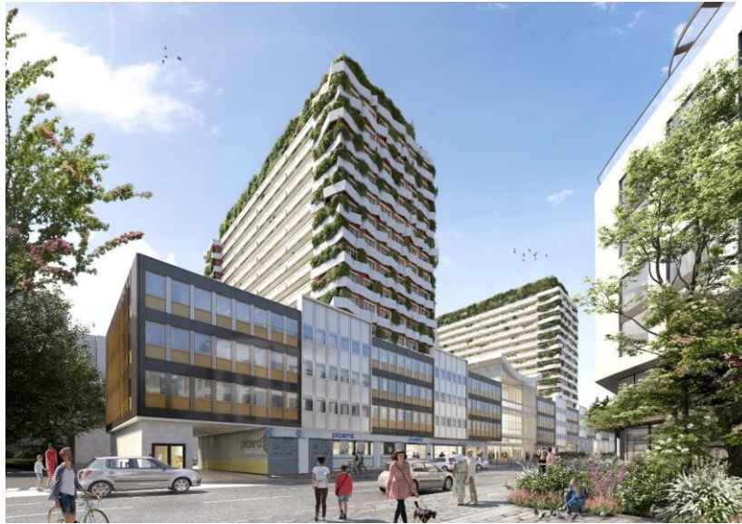
© Seine Ouest Habitat et Patrimoine

Le projet de réhabilitation d'un ensemble immobilier construit en 1968 de 315 logements locatifs sociaux, répartis sur 3 bâtiments de 17 étages chacun, prévoit de réaliser des travaux de grande envergure pour améliorer considérablement les performances énergétiques de l'ensemble des bâtiments, avec un passage d'une étiquette D à B.