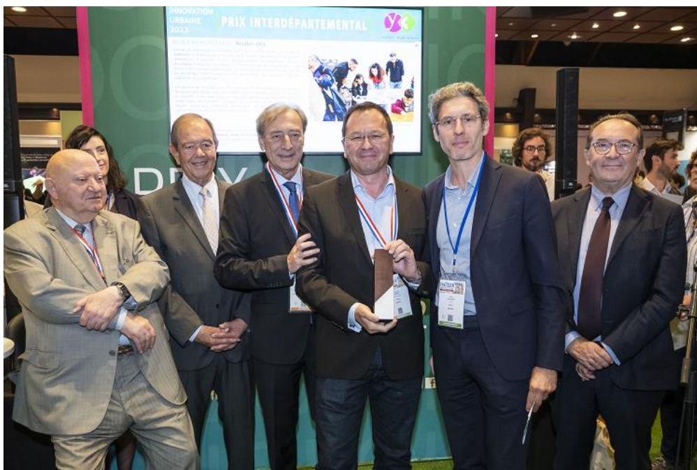
Prix interdépartemental de l'innovation urbaine 2023