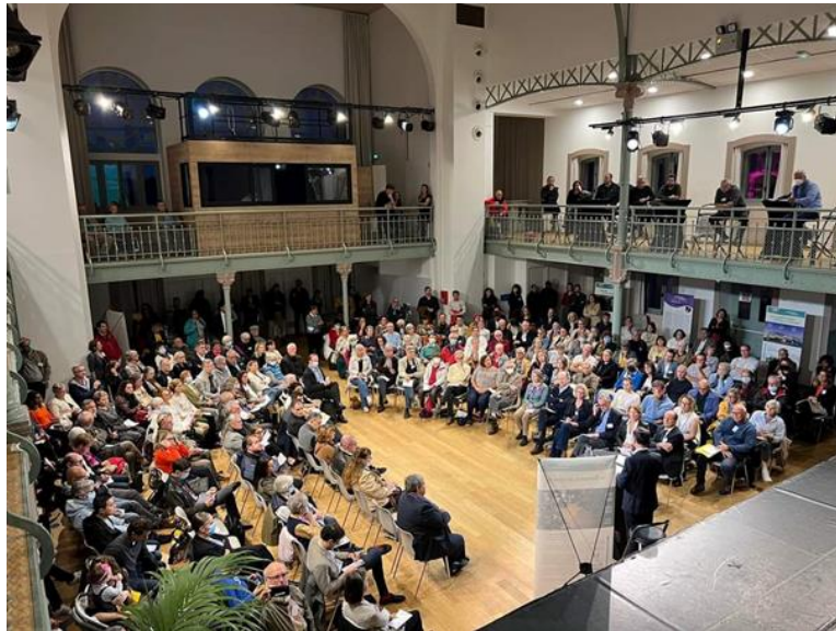
© Tiphaine Lanvin - Ville de Suresnes

Un dispositif continu de concertation stratégique et de force collective est l'axe majeur sur lequel la municipalité de Suresnes décline le système de gouvernance du projet très structurant de réaménagement/requalification du centre-ville.