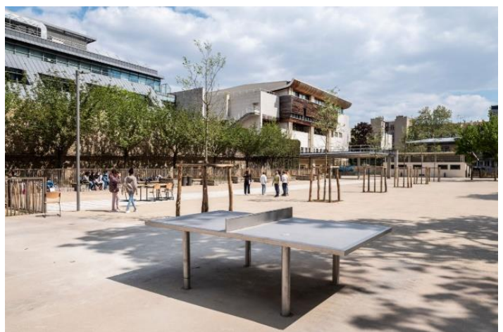
Cour collège Jean Macé à Clichy

Dans le cadre du projet « Imagine ton collègue », à l'initiative du Département, les collégiens ont participé à la réflexion sur l'aménagement de leur cour de demain . Ce programme de végétalisation des cours de collège est baptisé « Îlot vert ». Établissement pilote, le collège Jean-Macé à Clichy-la-Garenne, a inauguré son îlot vert fin 2021. Les chantiers ont ensuite été lancés aux collèges du Moulin Joly à Colombes (fin des travaux en mai 2022), Henri-Georges-Adam à Antony et des Bouvets à Puteaux. D'ici 2027, ce seront au total 38 collèges publics des Hauts-de-Seine qui seront ainsi réaménagés avec un budget estimé à 40 millions d'euros.