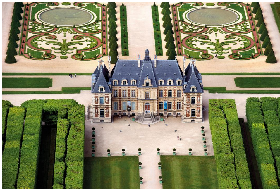
Domaine départemental de Sceaux