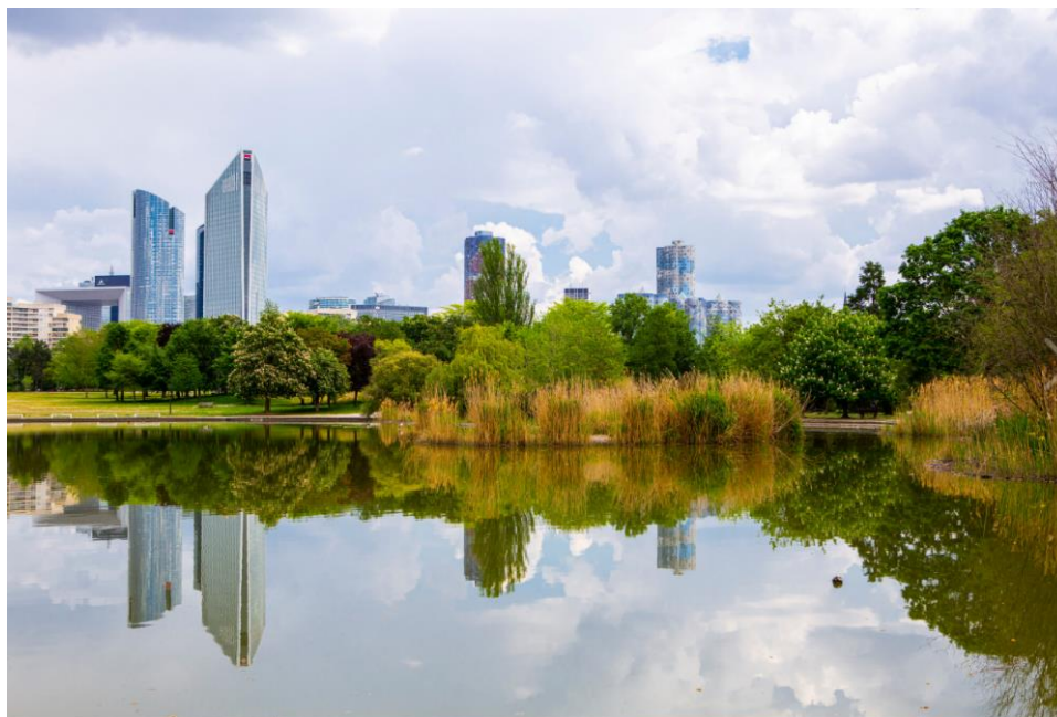
Parc André Malraux à Nanterre

Samedi 23 septembre Parc André Malraux – Nanterre