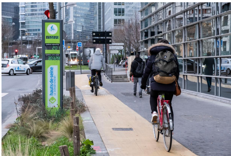
Piste cyclable et compteur à vélos sur le long de la D992 à Courbevoie en février 2023

Le Département s'engage à hauteur de 150 millions d'euros . Un investissement qui devrait permettre de porter à l'étude 120 kilomètres de voies cyclables supplémentaires . Ainsi, c'est près de 70 % de la voirie départementale qui sera équipée d'aménagements cyclables sécurisés et reliés entre eux, dont les « coronapistes » pérennisées.