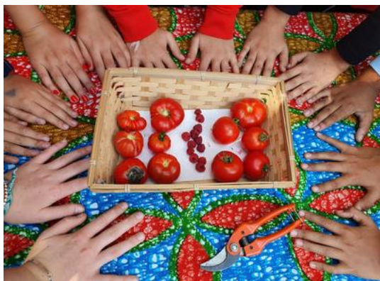
De la graine à la fourchette du collège Paul-Landowski (Boulogne-Billancourt) - Lauréat 2023

Ce dispositif permet aux collégiens de s'engager concrètement en faveur du développement durable de façon pédagogique avec des actions très variées : actions au bénéfice des acteurs de la solidarité et visant l'économie circulaire , permettant d'organiser à la seconde vie des matériaux, d'appliquer des éco-gestes, d'agir contre le harcèlement, de favoriser la transition énergétique, ou visant à la préservation de biodiversité et la connaissance des espèces.