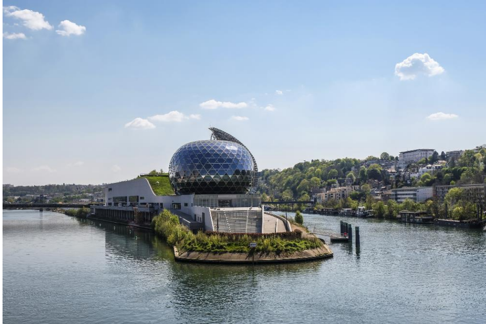
La Seine Musicale, entre Boulogne-Billancourt et Sèvres

Dimanche 24 septembre Île Monsieur – Sèvres