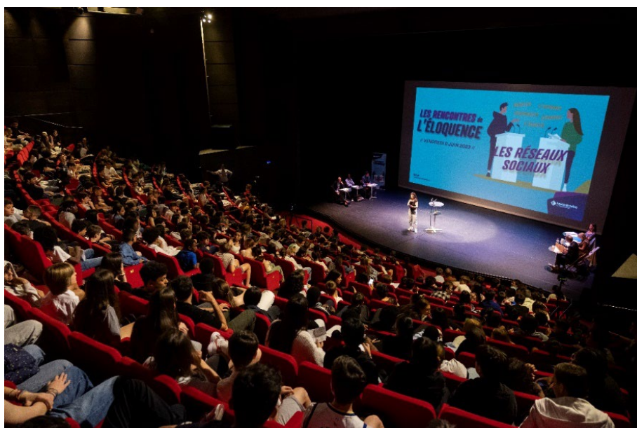
CD92 Julia Brechler

La troisième édition, qui portait sur la thématique des réseaux sociaux, a pris une dimension inter-dégré avec la participation de 14 classes de CM2 qui ont produit un podcast. Le bilan extrêmement positif de cette expérimentation donnera lieu à une nouvelle édition inter-dégré dont la thématique sera la suivante : « A bas les stéréotypes ! »