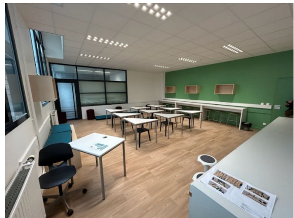
Salles d'étude du collège Gay Lussac à Colombes

D'ici la rentrée 2023, les autres projets élaborés l'année dernière seront réalisés. Cela concerne :