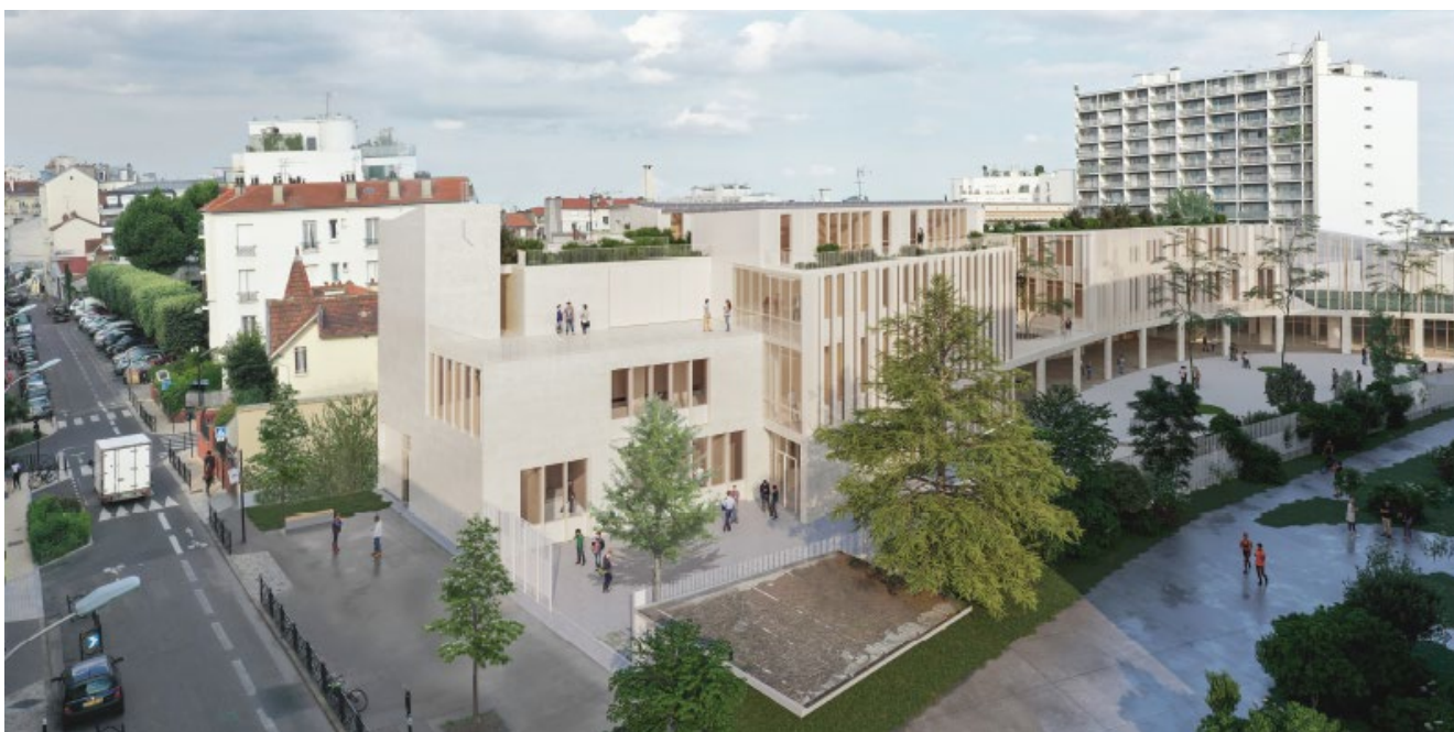
© Atelier Patrick Arotcharen – Perspective de concours d'architecture