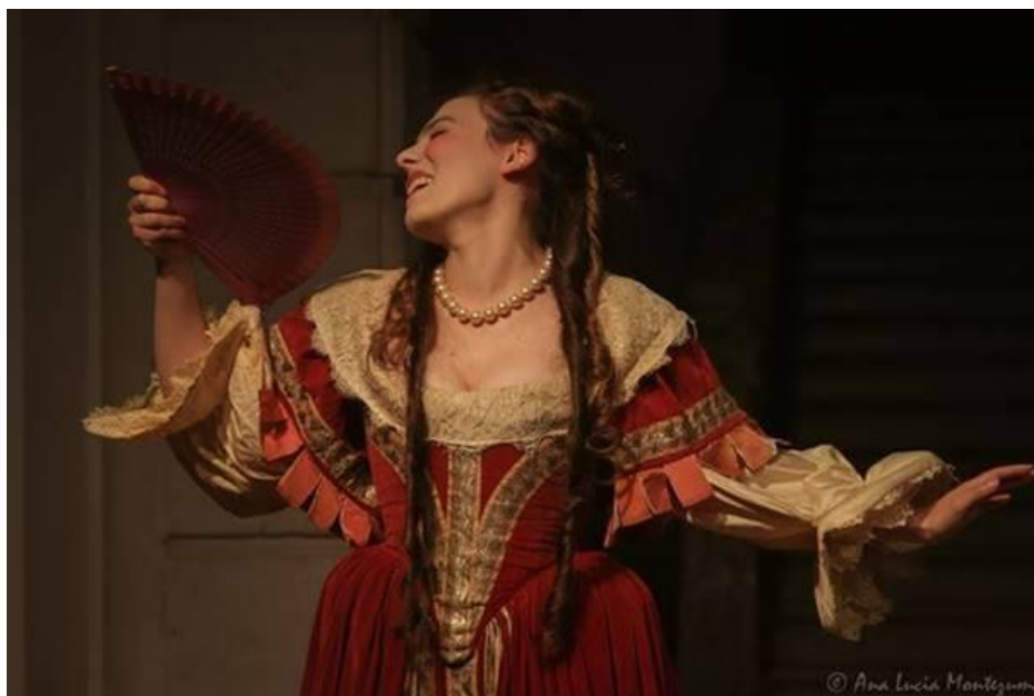
Musée du Grand Siècle – Journées européennes du Patrimoine - Théâtre Molière-Sorbonne

Direction artistique : Mickaël Bouffard, Théâtre Molière-Sorbonne