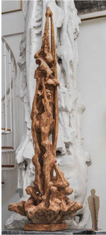
La Verticale – Terre cuite et plâtre de La Verticale dans l'atelier © Jacques Zwobada – Courtesy Anne Filali