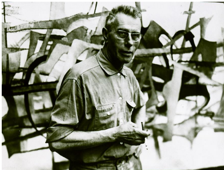
Jacques Zwobada

Récompensé à plusieurs reprises lors de concours et d'expositions, Zwobada est reconnu à l'aube des années 1950 comme l'un des principaux représentants de l'abstraction lyrique. Son travail sur le corps humain et la figure féminine, très présents jusqu'alors, évolue vers un style organique et abstrait , composé de rythmes et de formes qui se mêlent et se conjuguent avec harmonie.