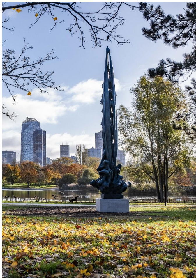
La Verticale de Jacques Zwobada au Parc départemental André-Malraux