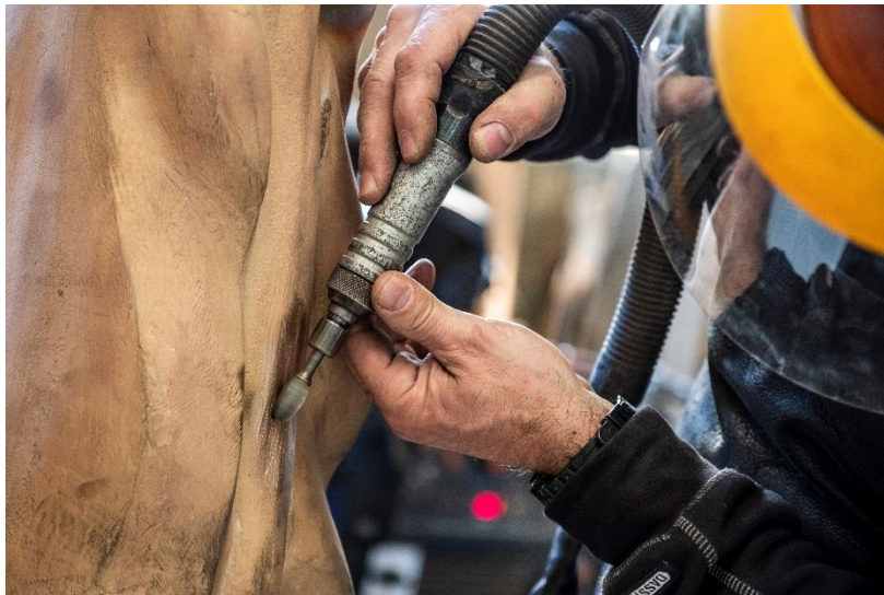
Détails de La Verticale à la Fonderie de Coubertin : ciselure