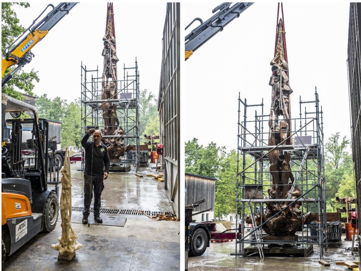
Assemblage de l'œuvre La Verticale à la Fonderie de Coubertin

Vidéo-reportage du Département des Hauts-de-Seine :